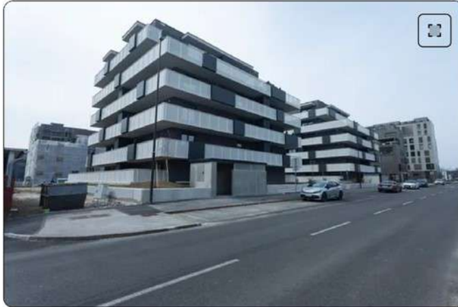
Rezidenca Zelena jama

bližini Šmartinskega parka. Kupci so se v dva vila bloka s skupno 40 stanovanji vselili lani spomladi.