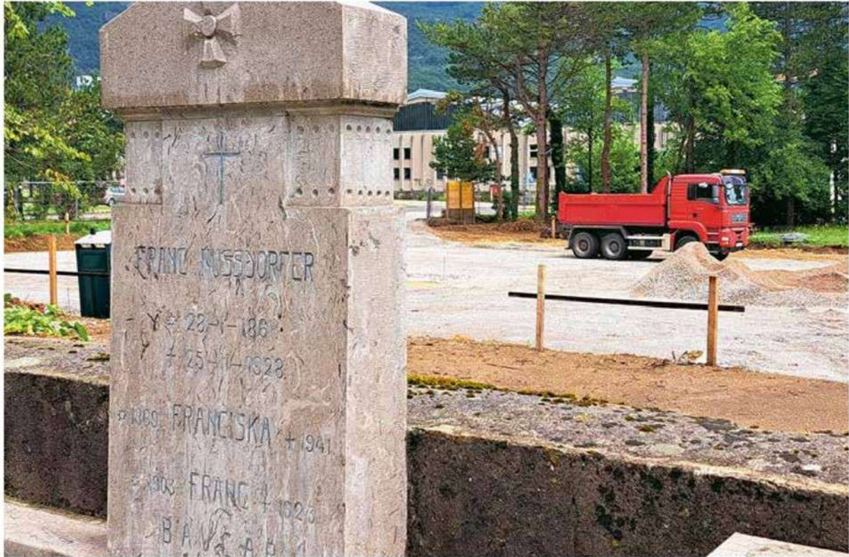
Dela na gradbišču novega stanovanjskega bloka že potekajo. Investitor je prepričan, da bo projekt pomembno prispeval k zagotavljanju ustrezne stanovanjske ponudbe za prihodnji razvoj Ajdovščine.

čakujemo potrebe po kakovostnih stanovanjih. Menimo, da bo projekt Rezidenca Lokavška pomembno prispeval k zagotavljanju ustrezne stanovanjske ponudbe za prihodnji razvoj Ajdovščine," meni.