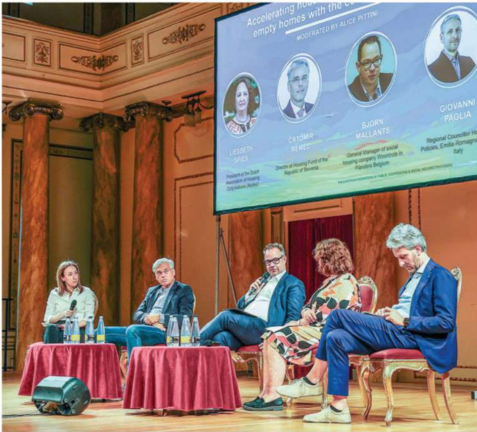
Kongres Mednarodne goste so povabili na oder male dvorane tržaškega gledališča Verdi