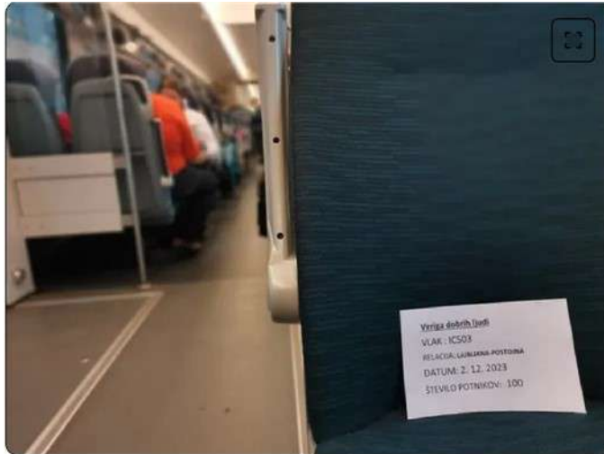
Prizor na vlaku