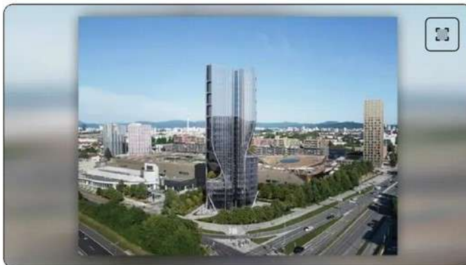
Vizualizacija stolpnice Severnica.

Datum začetka in konca gradnje še ni znan.